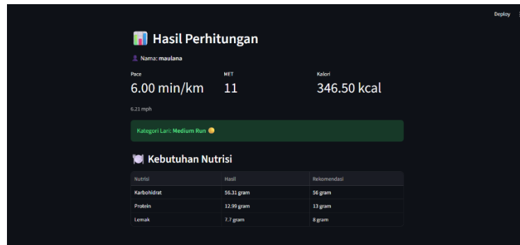
Gambar 3. Tampilan Output

Pada halaman output, sistem menampilkan hasil perhitungan secara otomatis setelah pengguna menekan tombol “Hitung Nutrisi”. Informasi yang ditampilkan meliputi identitas pengguna, nilai pace (menit/km), MET, total kalori yang terbakar, serta kategori aktivitas lari. Selain itu, sistem juga menyajikan hasil konversi kalori ke dalam kebutuhan nutrisi berupa karbohidrat, protein, dan lemak dalam satuan gram, sehingga pengguna dapat mengetahui kebutuhan nutrisi pasca berlari secara jelas.