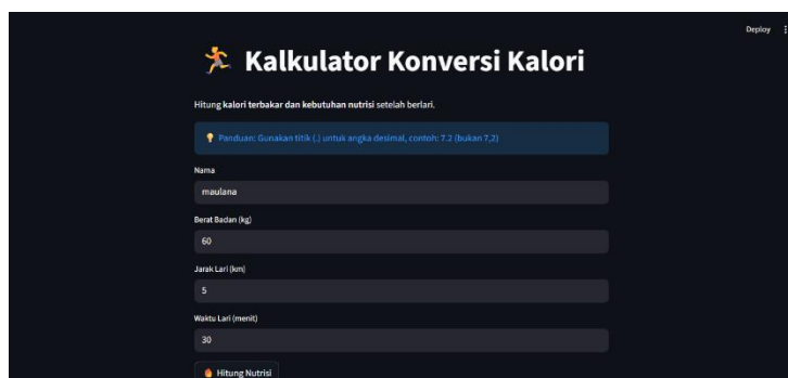
Gambar 2. Tampilan Input

Pada halaman utama, sistem menyediakan input sederhana untuk memasukkan nama, berat badan, jarak tempuh, dan durasi lari. Setelah data diisi, pengguna menekan tombol “Hitung Nutrisi”, kemudian sistem memproses dan menampilkan hasil secara otomatis pada halaman yang sama.